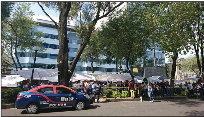
Figura 2. Ocupación provisional del camellón Álvaro Obregón para la evacuación de pacientes y personal médico durante el sismo de septiembre de 2017 en la Ciudad de México.

disponibilidad de camas adicionales, procedimientos para la expansión provisional del departamento de urgencias y otras áreas críticas; la forma y las actividades que se deben realizar en la expansión hospitalaria, como el suministro de agua potable, electricidad, desagüe, entre otros; los procedimientos para la habilitación de sitios para ubicación temporal de medicina forense, actividades específicas para el área de patología y si tiene sitio destinado para depósito de múltiples cadáveres (OPS, 2008). No contar con espacios libres dentro del nosocomio hace necesario el uso de calles, plazas o camellones para evacuar pacientes durante una calamidad (figura 2).