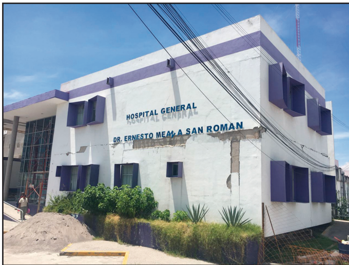
Figura 1. Hospital General Dr. Ernesto Meana San Román, en el municipio de Jojutla de Juárez, Morelos, dañado por el sismo de septiembre de 2017.

En 2017, los sismos ocurridos en México volvieron a hacer evidente (quizá con más fuerza) la importancia y la necesidad de una visión multidisciplinaria para la comprensión y respuesta por parte del sector salud en casos de desastre. El colapso y daño de algunos hospitales (sobre todo en los estados de Oaxaca y Morelos) despertó muchas preguntas e inquietudes para otros campos profesionales y su corresponsabilidad, tanto en la construcción de riesgos como en el entendimiento de los mismos (figura 1).