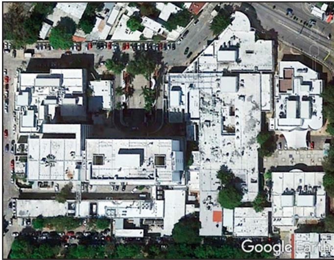
Figura 3. Hospital General Agustín O'Horán, Mérida, Yucatán, México.